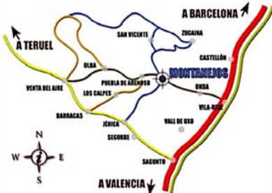
MAPA DE LA MARCHA